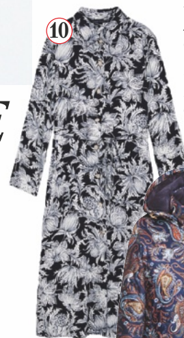
10. Платье, Zara, ок. 3000 руб.