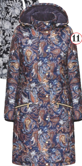
11. Куртка, Faberlic, ок. 4600 руб.