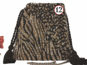
12. Сумка, Marks&Spencer, ок. 2500 руб.