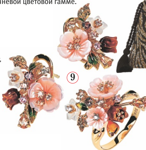
9. Серьги и кольцо из коллекции Eden, Sunlight, от 1990 руб.